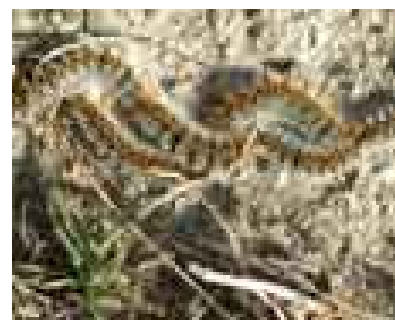
Chenilles en procession