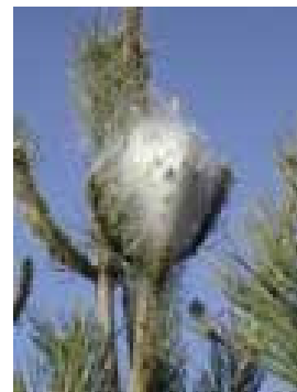
Nid d'hiver de la Processionnaire du Pin.

Votre contact, FREDEC Midi-Pyrénées 0562192230 secretariat@fedec-mp.com (Fédération régionale de défense contre les organismes nuisibles des cultures).